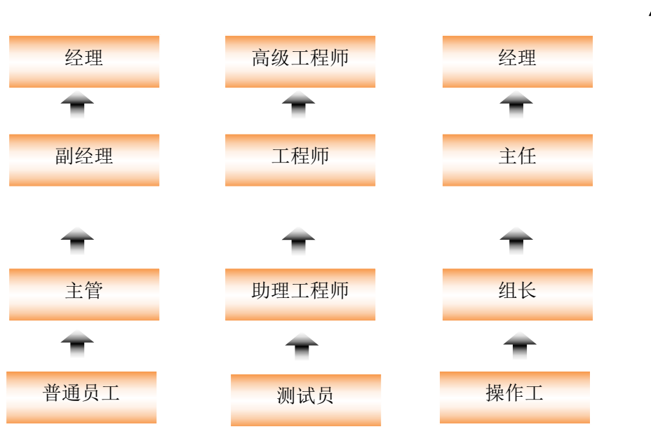
图表 2-8 员工职业发展/晋升通道